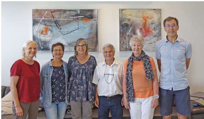
Der Vereinsvorstand von rAc zu Besuch bei «NOVIZONTE»

Der Vereinsvorstand besuchte am 7. Juni 2022 das Sozialwerk «NOVIZONTE» in Emmenbrücke. «NOVIZONTE»