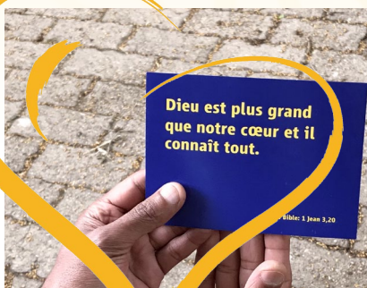
Et de Pain de Vie