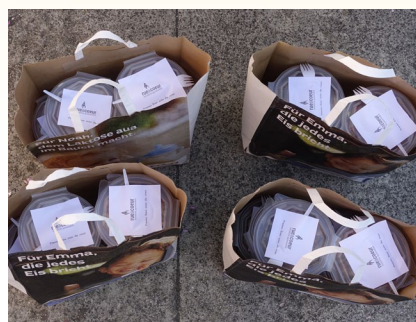
Distribution de repas

Laurent témoigne du fait que les personnes en précarité ou marginalisées sont encore plus démunies et en désarroi qu'avant la crise. Plusieurs points de contact et d'aide sont d'ailleurs fermés. Des personnes démunies et seules restent chez elles par crainte et s'alimentent mal. Un colis livré, un moment de partage